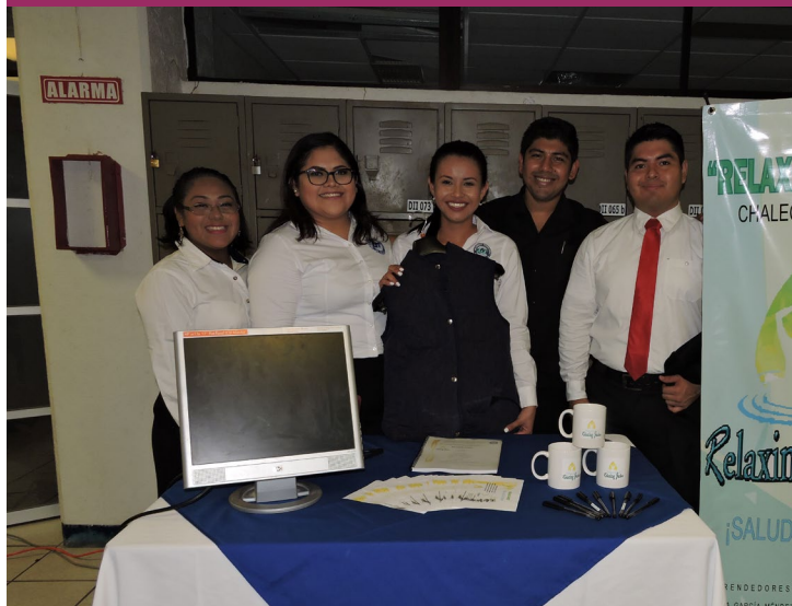
Exposición de Proyectos

Suites Silvana Hospital Médica Tabasco CMYK Servicios, S.A. de C.V.