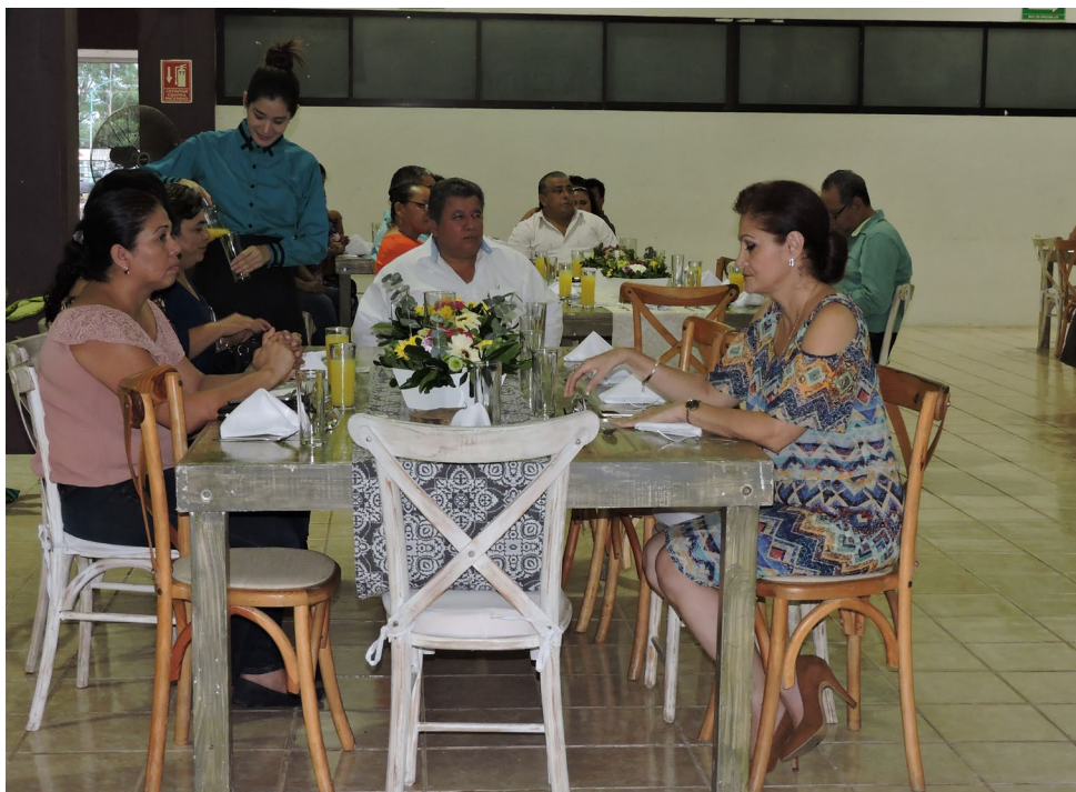
Los universitarios atendieron a los comensales

Familiares y docentes de los alumnos degustaron los alimentos que los universitarios prepararon con el siguiente menú: