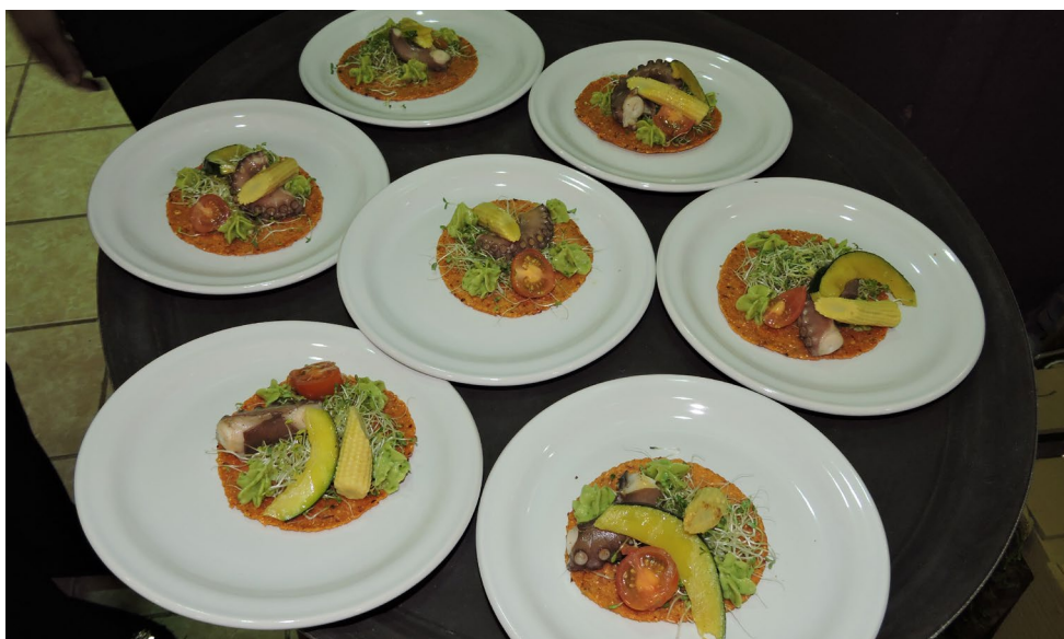
Parte del menú que degustaron familiares y docentes de los alumnos

Con estas actividades que desarrollan los estudiantes fortalecen sus conocimientos en la administración de un concepto gastronómico como lo es un banquete en el que son evaluados por sus habilidades culinarias respondiendo al perfil profesional que demanda el mercado laboral.