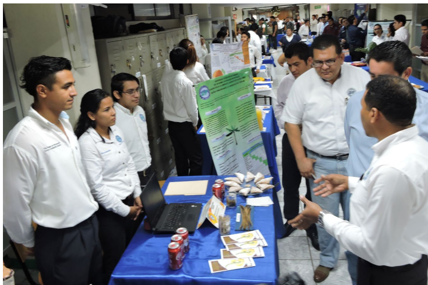
Recorrido de autoridades por la Expo Proyectos

Los alumnos mostraron avances de cada proyecto integrador correspondiente al cuatrimestre septiembre-diciembre en el que se les evalúa la metodología aplicada, así como las competencias profesionales.