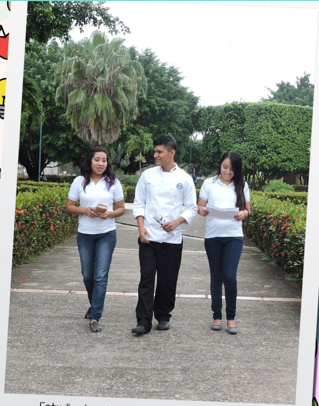
Estudiantes de 5 "A" de Gastronomía