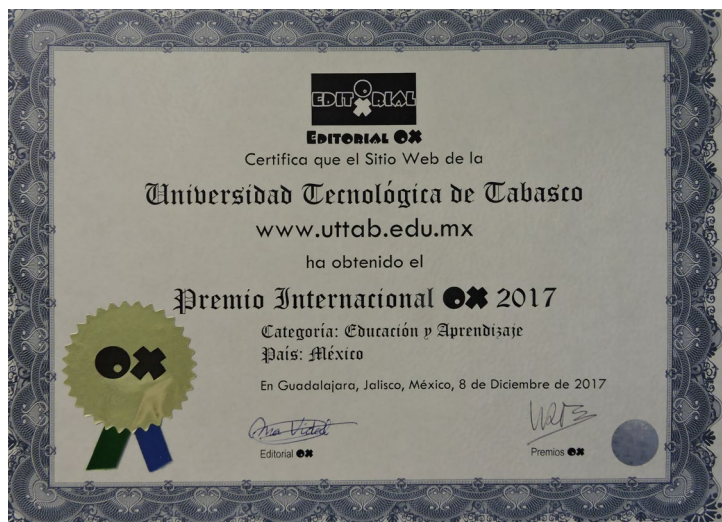
Premio Internacional OX 2017