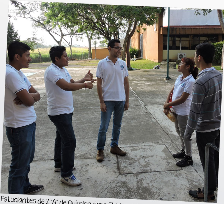
Estudiantes de 2 "A" de Química área Fluidos de Perforación