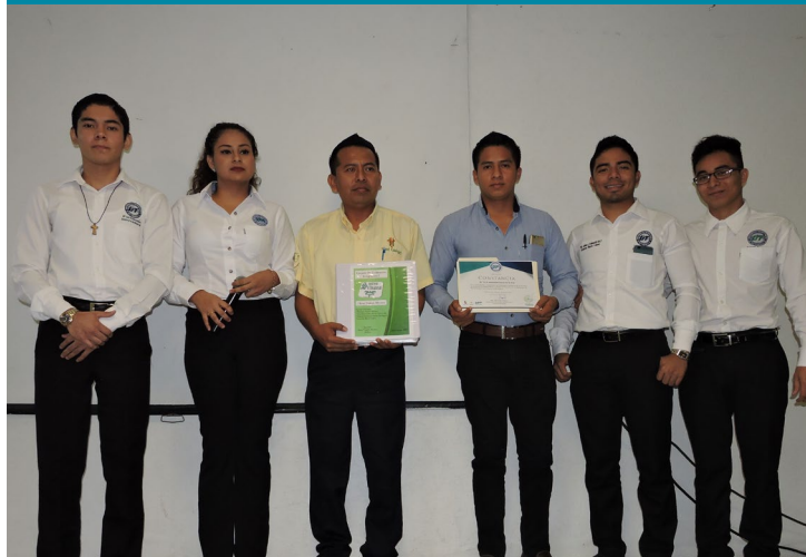
Empresarios recibieron el Plan Estratégico elaborado por los universitarios

Hotel Quintero Lemuu Cocohite Hangar Life Lasser