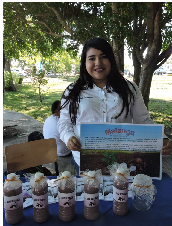
Proyecto: Horchata de malanga

Dentro de los proyectos presentados destacan brazo robótico, bebida de zacate de limón y matalí, máquina de control numérico computarizado, tortillas de maíz con moringa, dispositivo para la iluminación artificial y horchata de malanga.