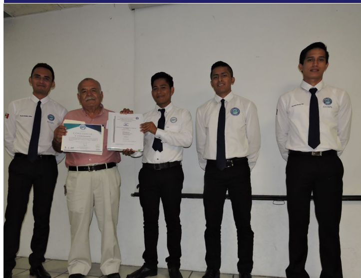
Empresario recibe Proyecto Integrador

Spill Solution Helados JEDE Eco Block El Valle de la Experiencia Oxxi Star Alisem Relaxing-Jacket Refor-tec Biotech Mix Chip FerVital Sun Energy