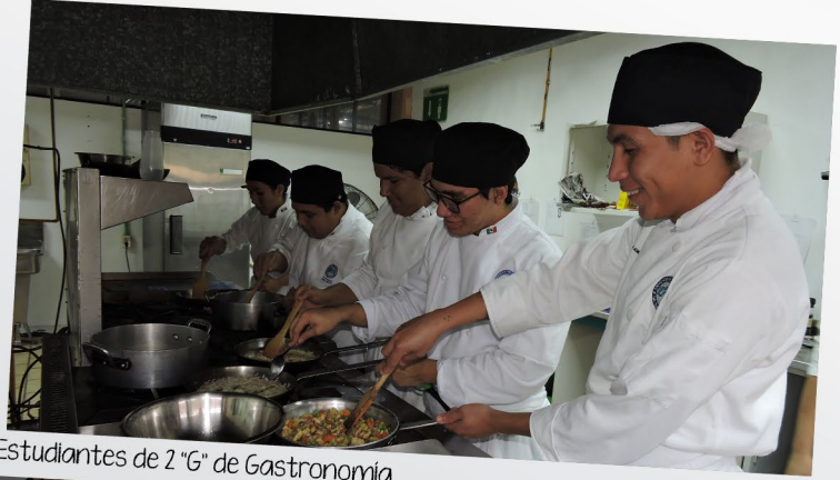
Estudiantes de 2 "G" de Gastronomía