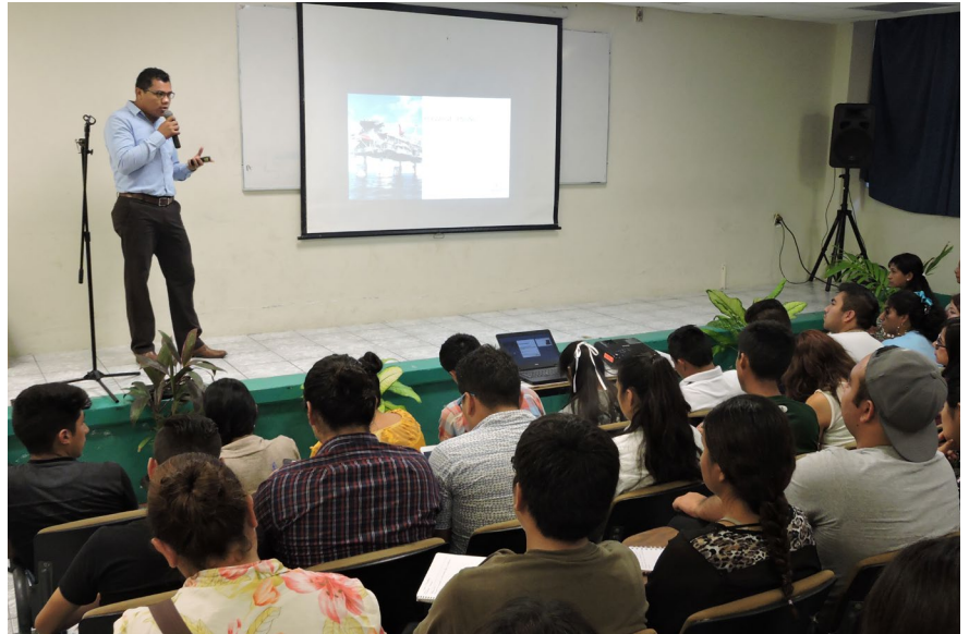
Champions de la empresa Emerson impartieron conferencias