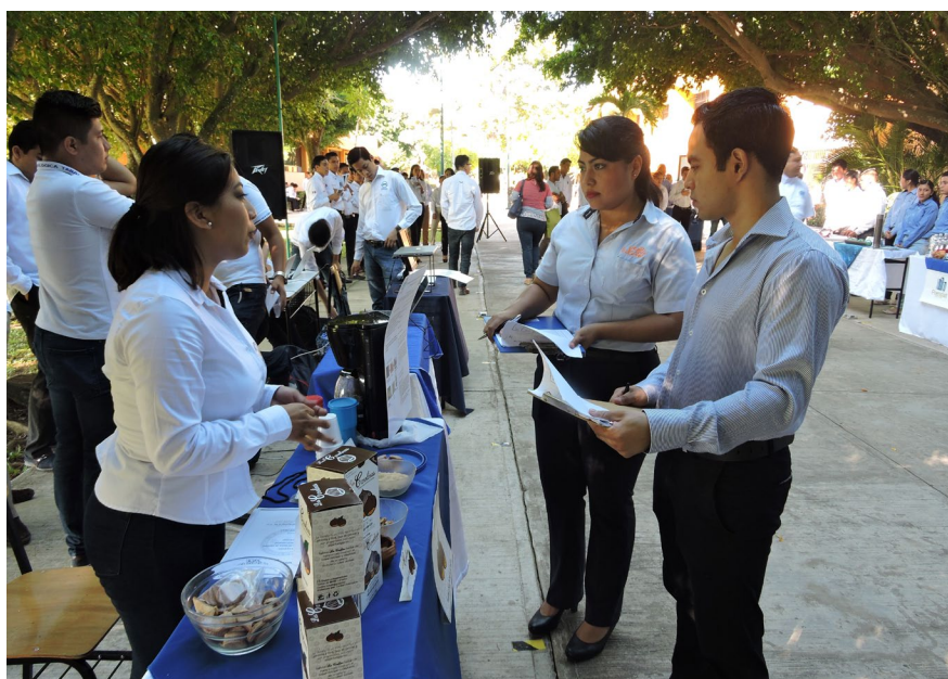
Empresarios evaluaron las propuestas de los estudiantes