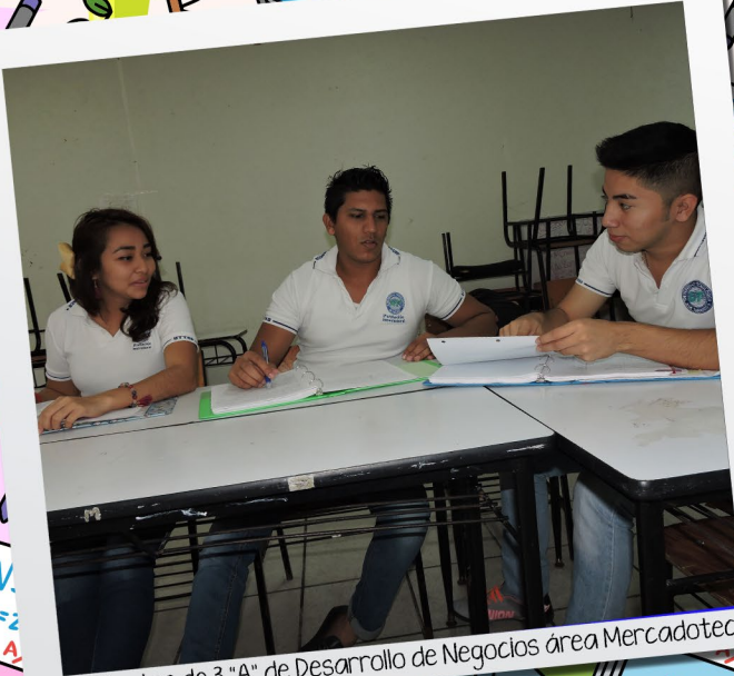
Estudiantes de 3 "A" de Desarrollo de Negocios área Mercadotecnia