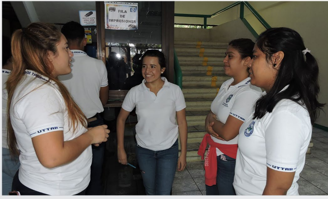
Estudiantes de 2 "B" de Gastronomía y 2 "B" de Química área Industrial