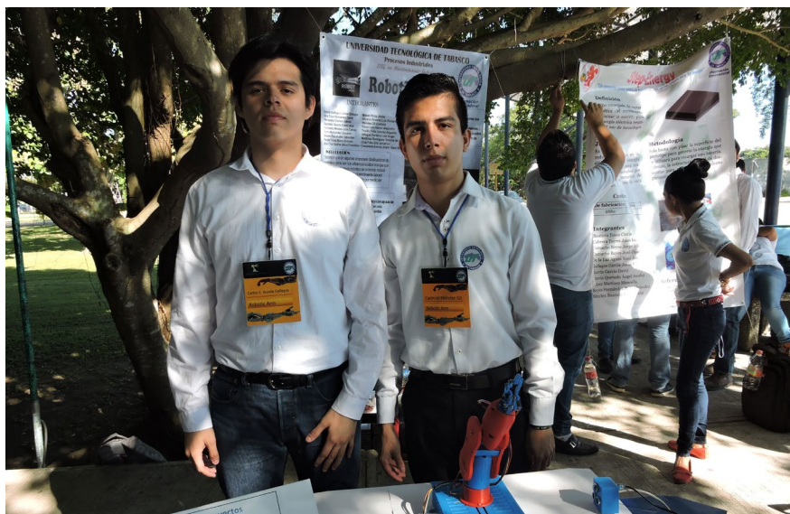
Proyecto: Brazo robótico

Cabe señalar que los alumnos visitaron la empresa Agregados y materiales “Petros de Tabasco, S.A. de C.V.”.