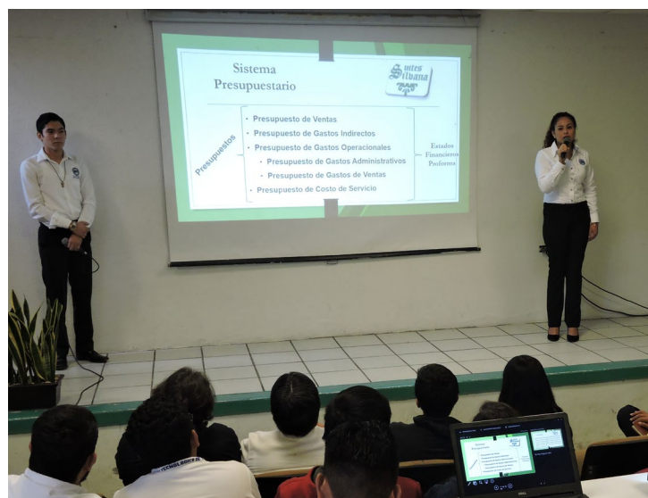
Estudiantes presentaron Planes Estratégicos