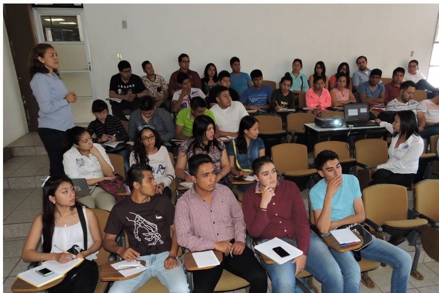
Estudiantes de la Universidad Politécnica de Energía asistieron a conferencias