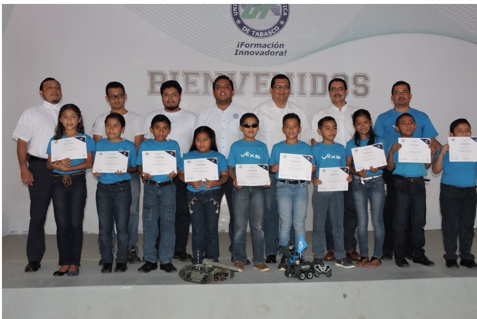
Autoridades universitarias con profesor y estudiantes de la Escuela Primaria "27 de Octubre"