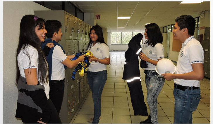
Estudiantes de 5 "A" de Administración área Formulación y Evaluación de Proyectos y 2 "A" de Desarrollo de Negocios área Mercadotecnia